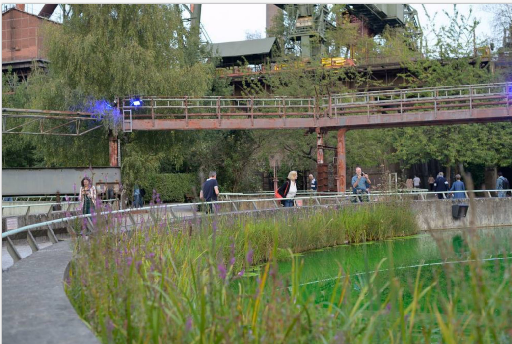
Viele Duisburgerinnen und Duisburger nutzten das schöne Wetter am Wochenende für eine kulturelle Reise durch den Park.